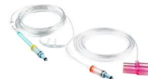
Линия отбора проб CO2