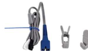
Ветеринарный датчик SpO2 Nellcor